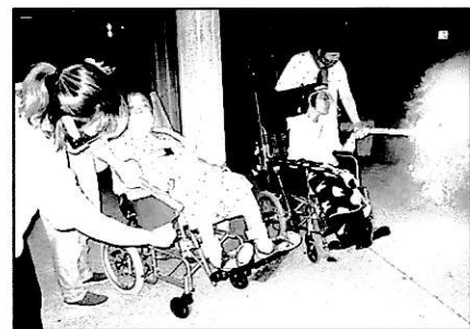
花火大会(2020年9月)の様子