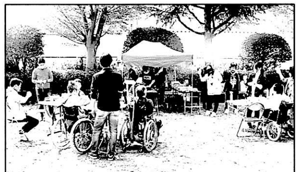
“屋外”バーベキュー(2020年10月)の様子