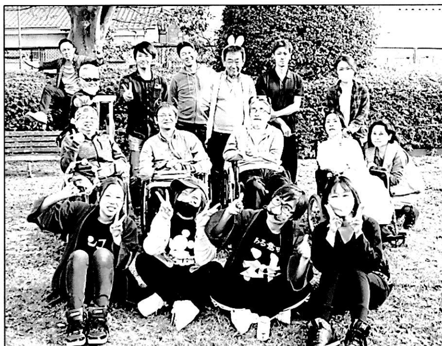
みんな“ゴキゲン！v(^-^)”(笑)